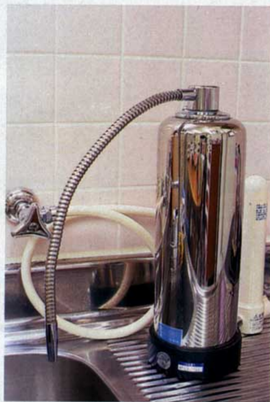
自然回帰水の製水器。家庭用は工事費別で16万円くらい。メーカーはタイセイ株。