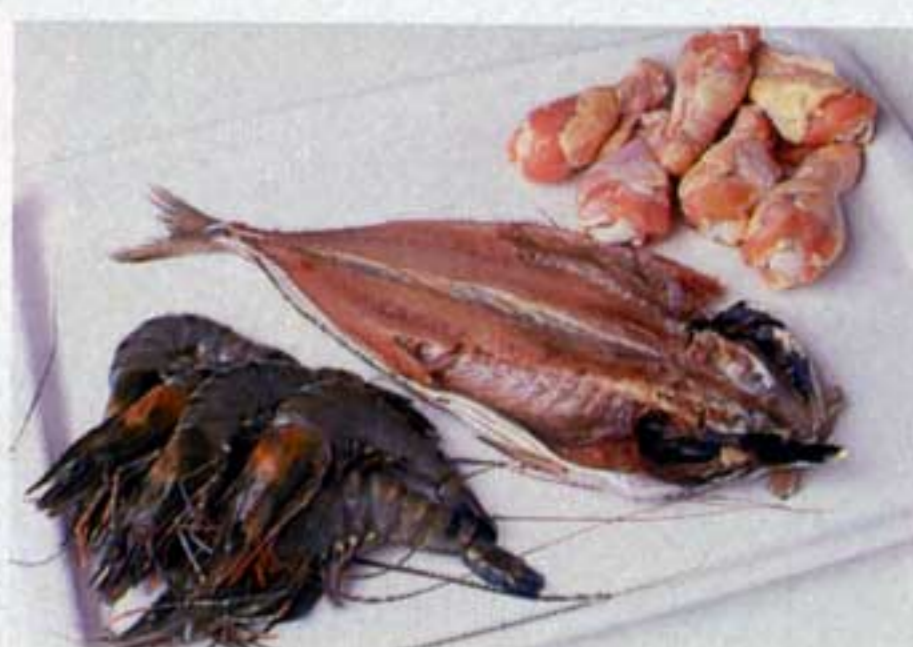
鱈の干物、海老、肉。自然回帰水に30分漬けてから冷蔵庫に入れると、生臭さがなくなつて、おいしくなる。